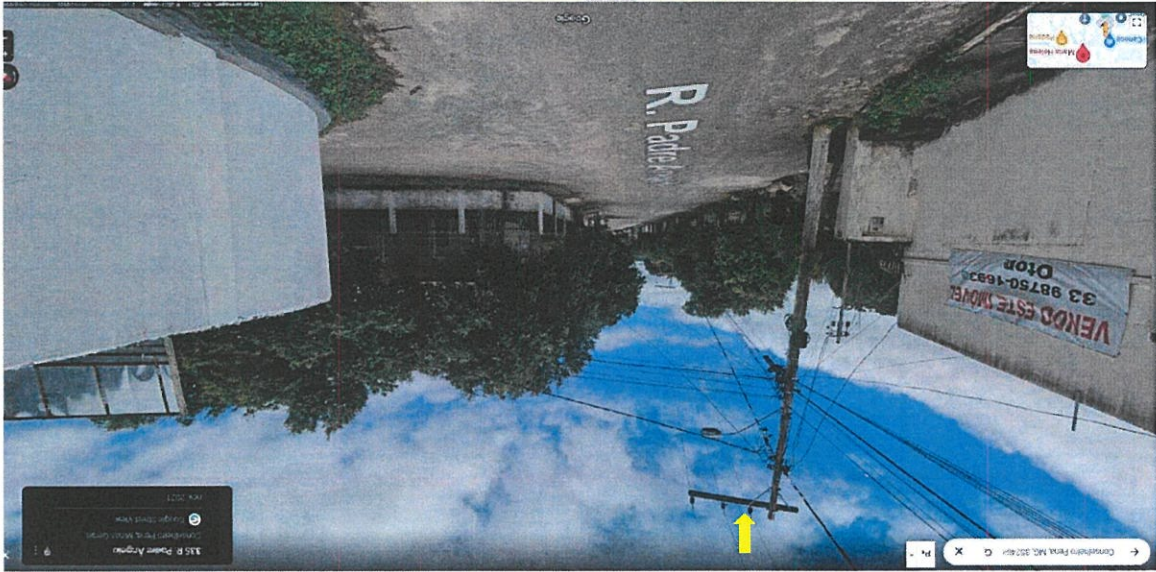
Imagem 03 - Rua Padre Angelo esquina com Rua Santa Luzia

Já na Imagem 02, é possível perceber que o fio do poste sinalizado já se encontra trouxo e ao atravessar para o outro poste ele desce o nível e não estão tão retos e esticados quanto os outros fios que aparecem na imagem.