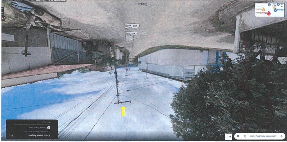
Imagem 02 - Rua Padre Angelo escurna com Rua Santa Luzia

A imagem 01 sinaliza o poste situado na Rua Padre Angelo, onde se inicia os fios que atravessam para a Rua Santa Luzia.