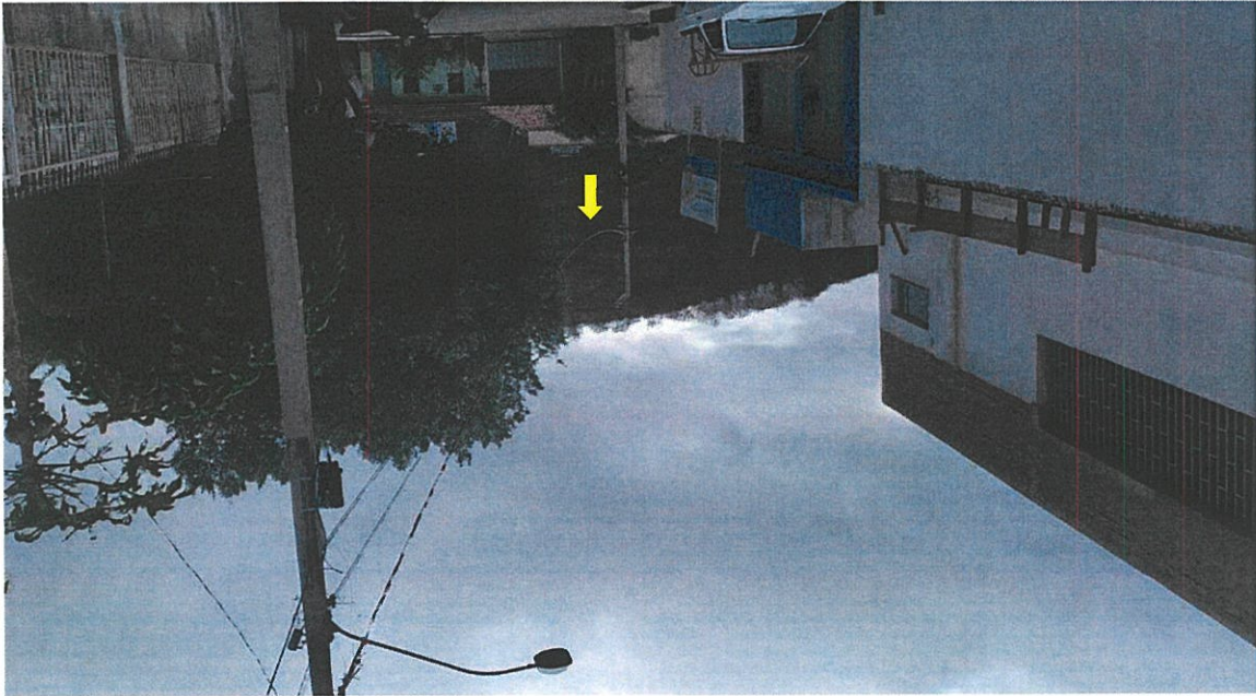
Imagem 05 - Rua Santa Luzia

A Imagem 05 foi registrada pela autora deste relatório no dia 25 de julho de 2023, onde percebe-se que o fio ainda está frouxo mesmo a Secretaria de Obras consentando o dano causado no poste.